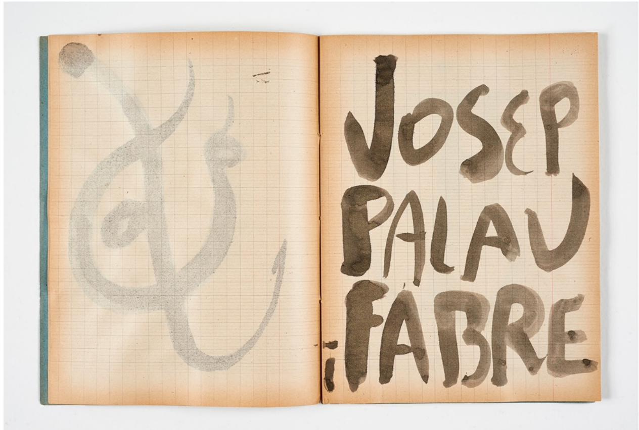
QUADERN D'ARTISTA ORIGINAL PER AL LOGO DE L'ANY PALAU I FABRE © Miquel Barceló